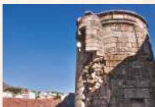
Castillo de Eljas