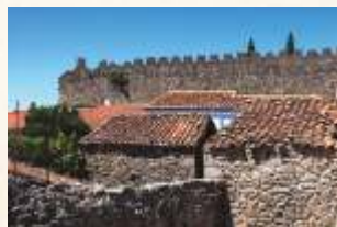
Santibáñez el Alto

Iremos después a Torre de Don Miguel , localidad a la que sus estrechas calles y característicos pasadizos confieren un aire pintoresco. Desde aquí subiremos a visitar Santibáñez el Alto y su castillo, ambos encaramados en un escarpado cerro; a sus pies, en la ladera sur, se localiza el barrio de los Pajares o de la Calzada, un conjunto de construcciones agrícolas declaradas Bien de Interés Cultural con categoría de Lugar de Interés Etnológico, a los que accederemos desde la carretera del embalse de Borbollón.