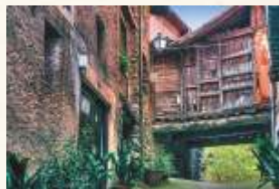
Robledillo de Gata

Finalmente remontamos el valle del Árrago pasando por Cadalso , donde aun existe la llamada Casa del Rey, en la que cuenta la tradición se encontraba Alfonso XI con su amante Leonor de Guzmán. Después pasaremos por Descargamaría para llegar a Robledillo de Gata , otro Conjunto Histórico en cuya oficina de turismo podremos recibir información. Como colofón subiremos hasta Puerto Viejo , el límite provincial con Salamanca, y conoceremos la cabecera del río Malvaao .