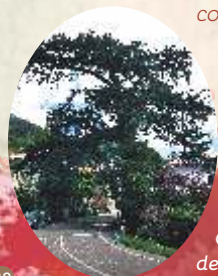
Cedro de Gata