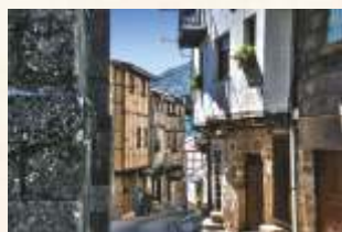
San Martín de Trevejo

Nos dirigimos ahora hasta San Martín de Trevejo , localidad en la que el agua forma parte de su estampa corriendo alegremente por las calles; aquí conoceremos sus casas palacio, la plaza porticada y el convento de San Miguel, hoy Hospedería de Turismo. Después iremos a Eljas para visitar los restos de su castillo, destruido en el s. XVII durante las guerras con Portugal, que fue cabeza de la encomienda de la Orden de Alcántara. Finalmente pasaremos por Valverde del Fresno para terminar subiendo hasta el puerto de Navasfrías , límite provincial.