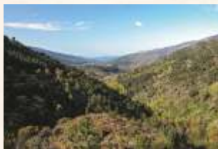
Valle del Árrago subiendo a Puerto Viejo