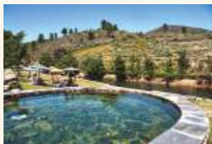
Piscinas naturales del Jevero (Acebo)

Como otras comarcas norteñas de Cáceres, Sierra de Gata sorprende por su constante caudal hídrico. Los ríos Erjas, Árrago, Tralgas y Malavao, este último el único perteneciente a la cuenca del Duero, y las riveras de Gata o Acebo, riegan sus campos desde las alturas serragatinas hasta la vega morala, ofreciendo la oportunidad de disfrutar del baño estival en las numerosas piscinas naturales de sus pueblos.