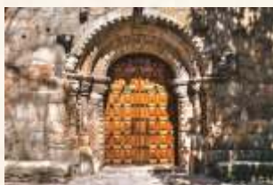
Portada tardorrománica, iglesia de Hoyos

El castillo de Trevejo se construyó sobre una fortaleza musulmana conquistada en el s. XII por Alfonso VII de León, quien se lo cedió a la Orden del Temple; después pasó a manos de la de S. Juan de Jerusalén, más tarde a la de Santiago y finalmente a la de Alcántara; ¡un castillo muy "ordenado"!