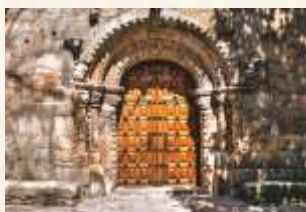
Façade tardorromanica, église de Hoyos

Le château de Trevejo fut construit sur une forteresse musulmane conquise au XII ème siècle par Alphonse VII de León, qui le céda par la suite à l'Ordre du Temple. Ce château passa par la suite entre les mains de l'Ordre de Saint Jean de Jérusalem, puis à celui de Santiago et finalement à l'Ordre d'Alcantara.