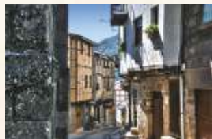
San Martín de Trevejo

Nous nous dirigeons maintenant vers San Martín de Trevejo . L'eau court allègrement dans ses rues et marque son identité. Nous verrons ses maisons-palais, la place entourée d'arcades et le couvent de San Miguel, aujourd'hui converti en Logement Touristique. Nous irons par la suite à Eljas , pour visiter les restes de son château, qui fut détruit au XVIIème siècle durant les guerres contre le Portugal. Enfin, nous passerons par Valverde del Fresno et pour finir, nous monterons jusqu'au port de Navasfrías, à la frontière de la province.