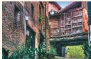
Robledillo de Gata

Enfin, nous remonterons la vallée de l'Árrago , en passant par Cadalso, où se trouve encore la Maison du Rey. La tradition conte que c'est là qu'Alphonse XI rencontrait son amante Leonor de Guzmán. Nous passerons ensuite par Descargamaría pour arriver à Robledillo de Gata . Dans le centre historique, l'office du tourisme nous offrira des informations sur la région. En guise de conclusion, nous monterons jusqu'à Puerto Viejo, point limitrophe avec la province de Salamanque et nous connaissons la source du fleuve Malavao.