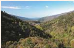
Vallée d'el Árrago