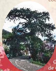
Cèdre de Gata