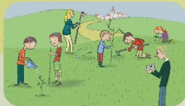
Fiesta del Árbol

...te recomendamos que conozcas la historia del aceite y del olivo en esta comarca, acudiendo al Museo del Aceite "Molino del Medio" de Robledillo de Gata que te contará la extracción del aceite, la maquinaria que emplean, etc.