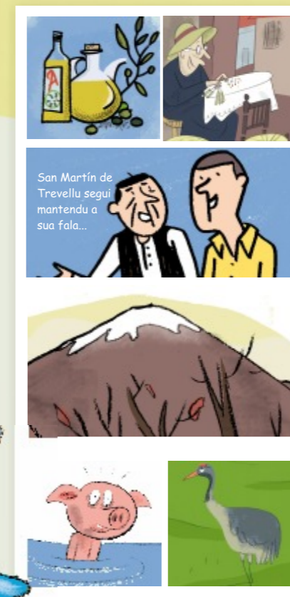
San Martín de Trevejo segu mantendu a sua fala...

los dibujos te dan pistas para encontrar las palabras