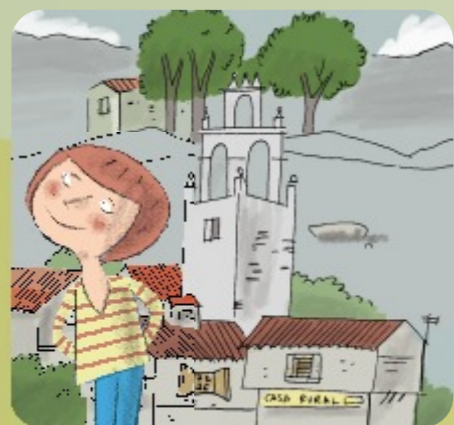
Robledillo de Gata